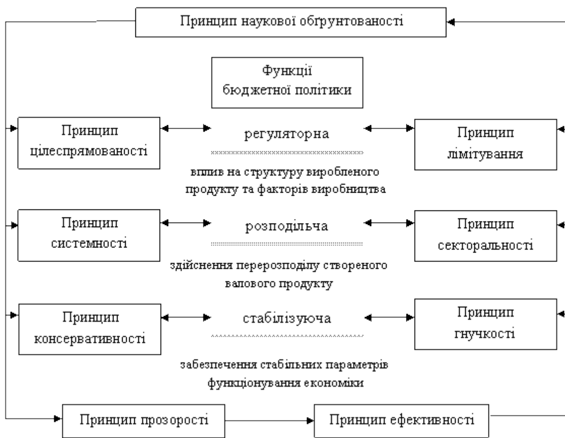
Рис. 1. Принципи реалізації бюджетної політики *розроблено автором

Виклад основного матеріалу дослідження. Чинником організації принципів бюджетної політики є її функції. У праці [0, с. 8] відзначаються наступні функції: регуляторна, розподільча, стабілізуюча (рис. 1).